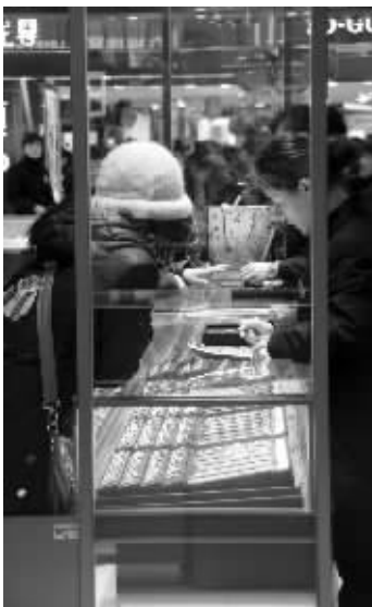
黄金柜台前挤满了顾客