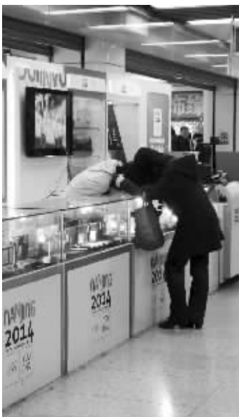
青奥纪念品也很受欢迎