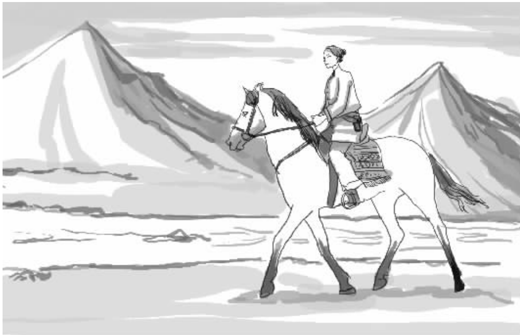
张王氏被描绘成一个骑马佩枪的奇女子 漫画 俞晓翔