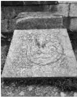
午朝门公园内的龙石刻