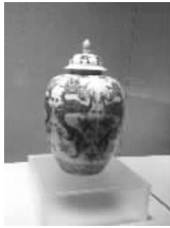
清代青花龙纹瓜棱形瓷盖罐