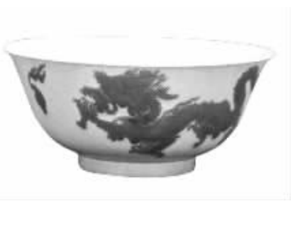
清代贵妃用的黄地绿彩双龙纹瓷碗