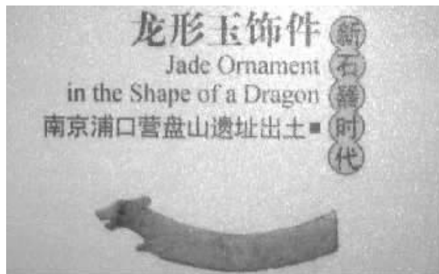
南京新石器时代龙形玉饰

记者走访了南京的大街小巷、文物古迹,发现南京年代最久远的龙应该是在朝天宫南京市博物馆内展出的两条了。这两条龙来自新石器时代,是出自南京浦口营盘山遗址,是两件龙形玉饰件。这两条龙一条是“抬头龙”,脖子是往上抬的,另一条则是“俯首龙”,龙头是往下弯的。