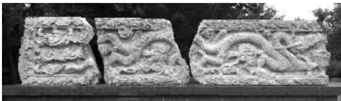
下马坊公园里的“多腿龙”

一条龙应该几条腿?按照今天来看应该是4条腿,当然在远古时代也出现过独腿的叫“夔”的龙。但是五六条腿的龙你见过吗?在下马坊公园内,这里的龙就不止4条腿,你能找出五六条腿来。