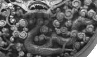
天王府旧址里的宝贝龙

的龙壁也是由断壁拼凑的。当时明故宫应该多处有这样的石壁,但因为毁于战争,这些石壁就七零八落散落在各处了,后来为了复原,就把能拼凑到一起的几块复原。