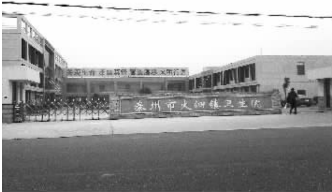
被国土部门查处过“以租代征”的卫生院