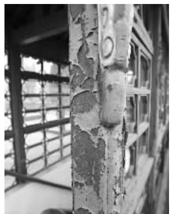
鼓楼破损严重,急需修缮