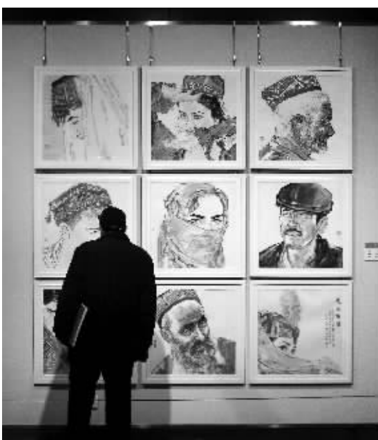
市民参观高云作品