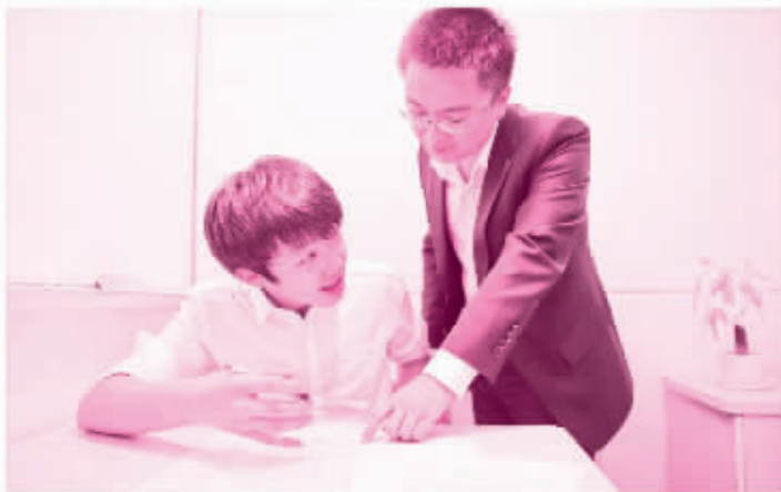
力、查漏补缺、模拟练习。

4) 复习一定要做到系统化,精细化和个性化。同时,复习的方法也很重要。可以把考前复习分成四个阶段:基础复习、强化能