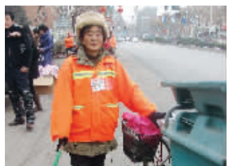
环卫工戴上暖和的新帽子

棉帽的颜色和环卫工作服颜色一致,都是黄色,样式和老式军棉帽很相近。环卫所负责人介绍,这些棉帽里面都有棉胆,加厚加丝绒,防风、防雪、防冻、护耳。建邺区环卫所负责人表示,他们也注意到了此前媒体的报道,但这次发放棉帽主要是因为马上天气更加寒冷,考虑到可能会出现下雪天气,环卫系统职工任务很重,凌晨和夜间扫雪保障交通,作业时会很寒冷。配备防寒防风帽是为了扫雪做准备。