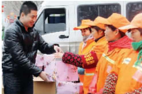
环卫工人收到爱心年货,笑得很开心