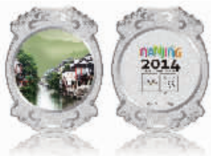
宝庆银楼青奥纪念章

春节前红火的年货市场上,除了传统的吃喝穿戴用品,黄金首饰、金银条、金元宝等也成为不少市民选购的高档年货。记者昨日从太平南路的宝庆银楼总店获悉,元旦三天,宝庆银楼营业额比去年上涨60%,为配合市民年货需求,宝庆银楼今年提前启动金银年货产品,推出金银精工年货展,上百种金银品类上万件金银产品悉数上柜。