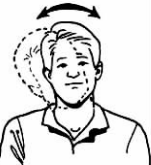
2. 缓慢将头部倾向一侧肩膀,然后倾向另一侧