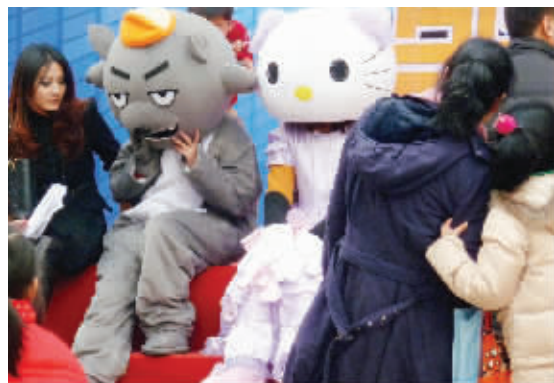
当灰太狼遇上hello kitty,我又相信爱情了…… 摄于山西路。 (作者鲁弦获30元话费)