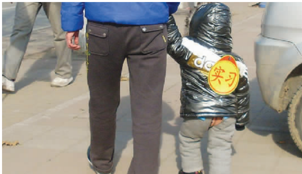
爸爸,我啥时候才能转正啊,当实习宝宝都这么久了。1月7日摄于常州清凉东路。 (作者周文溪获30元话费)