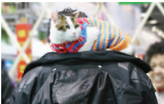
你们不要老是看我,我才没工夫搭理你们呢!我要对着镜头摆POSE。1月7日摄于国展中心。 (作者陈丹丹获30元话费)