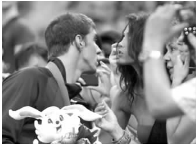
曾经的甜蜜已成往事?

尽管当事人三缄其口,但仍有媒体猜测,菲尔普斯在2011年7月上海游泳世锦赛前闹出的绯闻有可能影响到了他与妮可的关系。世锦赛之前,菲尔普斯被曝出与一个比他小两岁、名叫阿什利的加拿大姑娘如胶似漆,两人的地下恋情当时已有两年。阿什利的朋友爆料:2011年菲尔普斯参加加拿大游泳赛时,与阿什利在酒店度过了整个周末。这个“小三”之所以可信度高,就在于被曝光的时间距离现在最近,同