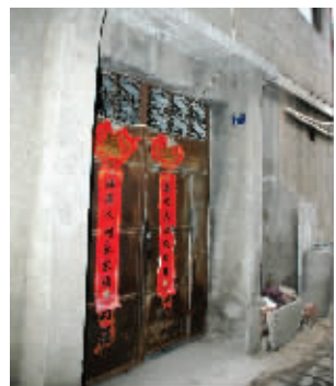
发生劫案的沛县县城七巷东21-9号