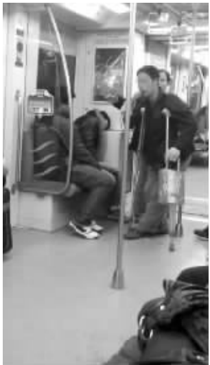
带着设备乞讨 请供图网友来领稿费

昨天有网友抓拍到了地铁雷人一幕,一男一女边唱边乞讨,噪音让乘客纷纷提意见。这件事在网络引发了热议。这种职业乞丐,遇到了该不该给?还有,像地铁和新街口商业区这些的“禁讨区”,还是有不少乞讨人员流动,网友们认为禁讨令如今成了一纸空文。