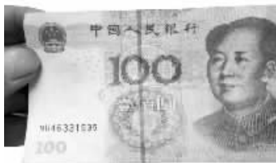
几乎以假乱真的假币