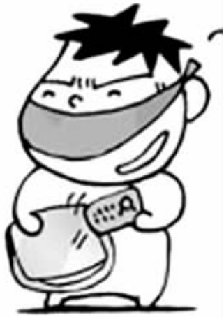
钱证一起放,被偷更麻烦 (资料图片)