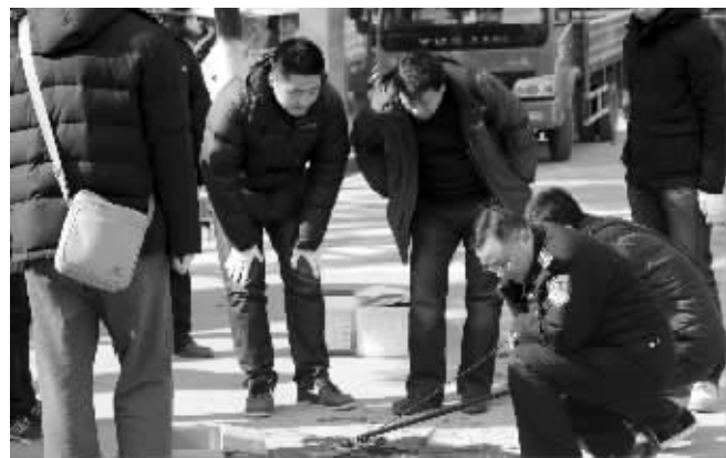
警方在案发现场勘查