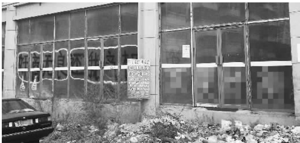
盐城仁和都市广场外部堆放着垃圾,无人过问