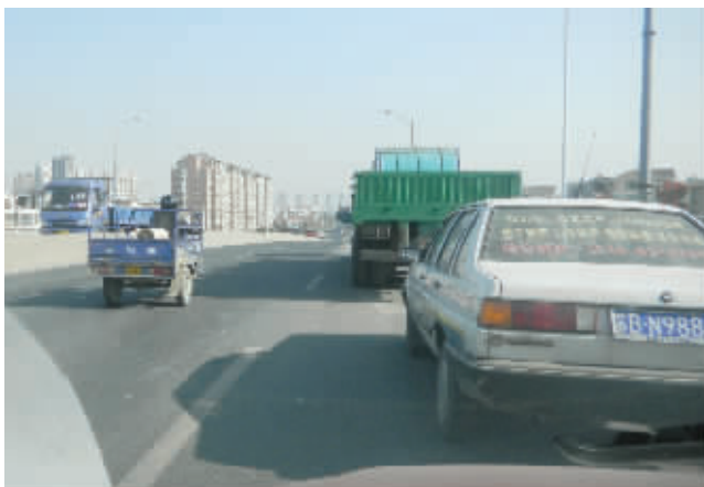
三轮车在机动车道上悠然自得地跑着(左图),遇到红灯三轮车也不停

前天上午10点左右,记者来到新光路目睹了该条高架桥上“各路人马”违规驾驶的真实景象。10点05分,一辆载着玻璃、木材的“宗申牌”机动三轮车驶上高架,该三轮车的驾驶员没戴头盔。随后,一辆红色电动车从高架桥上疾驰而过,车上的两人也全都没戴头盔。10点12分,“轰隆隆”的声音传来,只见一辆车头沾满泥土,满载着建材的大型卡车驶上高架桥,当它从身边驶过时,记者感觉桥面一阵抖动。