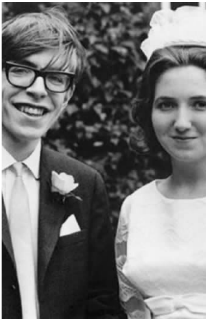
霍金与前妻珍·怀尔德