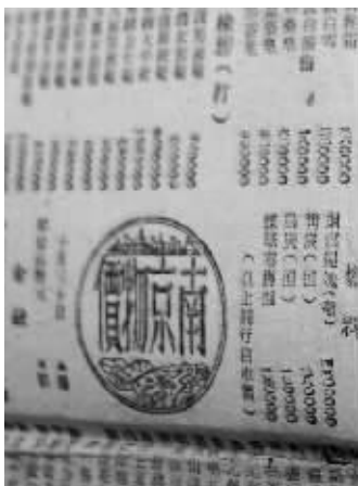
老报纸上刊登的当时物价

一份泛黄的老报纸,能卖到几百元甚至上万元?被人们当废品卖掉的旧报纸竟有如此高的收藏价值。近日,记者从朝天宫古玩市场几家从事报纸收藏的商户处了解到,老报纸收藏时兴的时间虽然不长,但已经有着一定数量的热衷者。老报纸既没有“红宝书”值钱,也没有小人书趣味性,更不像古籍善本那样具有学术价值,到底老报纸有着怎样的独特魅力呢?