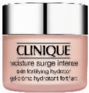
推荐产品: Clinique倩碧精华霜 RMB490/50ml

保湿面霜, 是肌肤健康的必备, 我们平时为了让肌肤不干燥, 使用保湿面霜是每日的护肤功课。季节变化和外界污染让很多上班族的肌肤变得极为干燥, 于是一款高效的保湿面霜成为一年四季保湿的重量级武器。不过, 你知道哪些保湿面霜最得护肤达人们的欢心吗? 你知道保湿面霜应该怎么选怎么用吗? 本期《品尚》美妆盛典带领你一起定制保湿之星, 推选出三大备受美妆达人喜爱的保湿面霜, 让肌肤的水分不再流失。