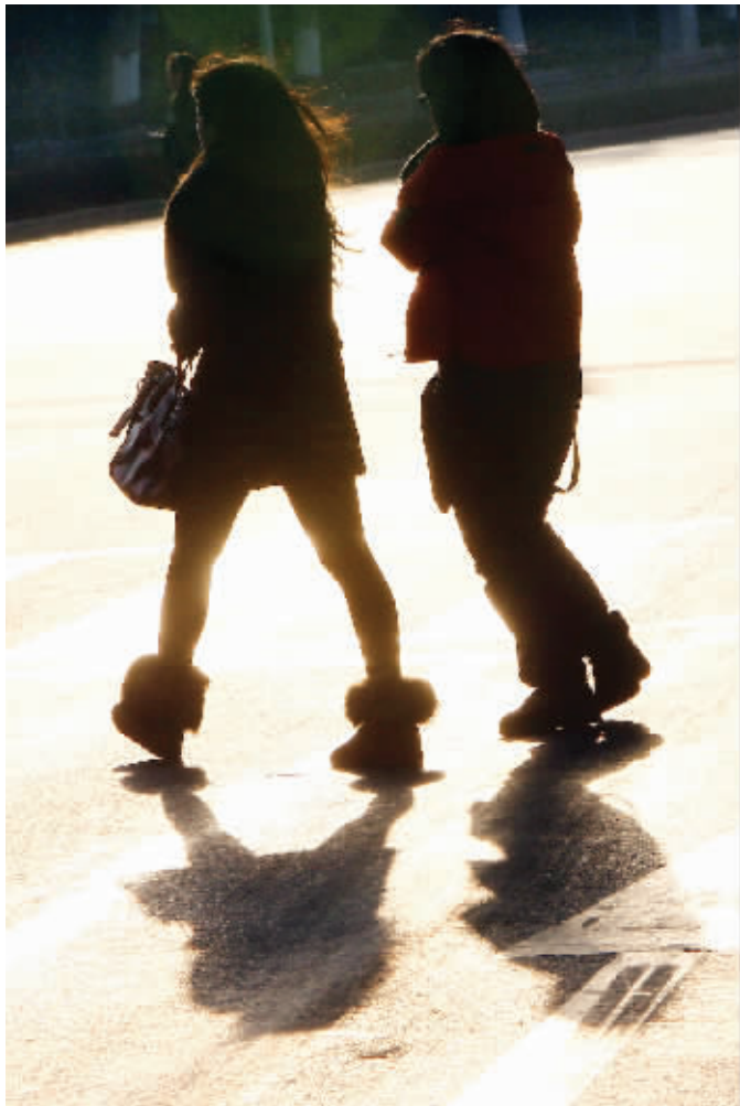
昨天,阳光灿烂,行走在路上,多了些温暖

气象专家表示,小寒前后之所以寒冷,是因为1月上旬强冷空气及寒潮冷锋活动频繁。每次冷空气过程前后都会造成气压、温度、湿度等气象要素的剧烈变化,人们往往难以适应而感染各种疾病。