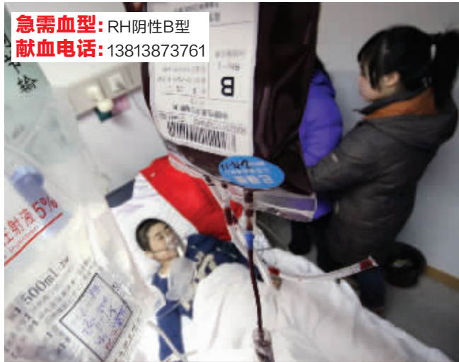
急需血型: RH阴性B型 献血电话: 13813873761