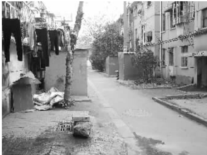
单元楼下的铁皮棚大部分都住着人