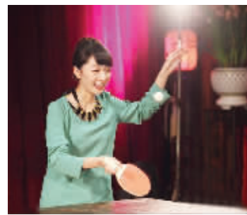
周冬雨和窦骁近日做客《可凡倾听》,笑谈人生成长经历,还现场切磋乒乓球技。

乐坛方面,张学友、王菲凭演唱会巡回演出收入过亿,双双成为乐坛至尊吸金王与吸金后。 鱼儿