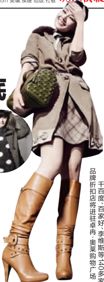
千百度、百家好、李维斯等140多家品牌折扣店将进驻卓冉·奥莱购物广场