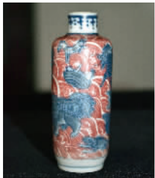
青花釉里红鼻烟壶

在今年中国嘉德秋拍中,一件清乾隆御制铜胎画珐琅彩欧式仕女图鼻烟壶以782万元成交,成为内地拍卖场上最昂贵的鼻烟壶。据悉,鼻烟原本活跃于欧美市场,16世纪末才由西方传教士传入中国,聪明的国人就制作了精美的鼻烟壶当做容器,并在清朝时期得到空前的发展,成为一个朝代的时尚象征。近日,记者从朝天宫古玩市场内几家古玩收藏商户处了解到,我国鼻烟壶种类繁多,质地多样,而且近两年日益受到藏家的青睐。