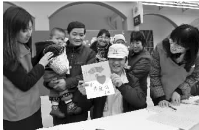
新年快到了,云林街道为不能回家过年的新市民提供了500多张免费的贺卡,供他们邮寄牵挂和祝福。

在无锡动物园的鸕鹚舍里生活着“世界第二大鸟”鸕鹚家族,为了能让小朋友们近距离地接触鸕鹚,无锡动物园特地为鸕鹚舍的外场搭建了一个平台,在每天的10:00—10:30和13:30—14:00,迎接小朋友们投喂。投喂时请在饲养员的指导下有序投喂。