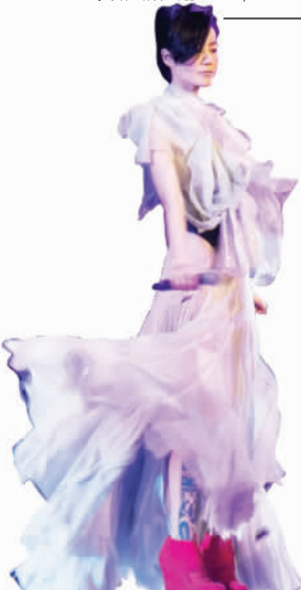
亲,开玩笑的哦(设计台词)