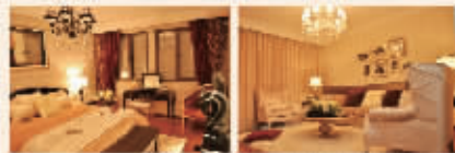
城开御园精装户内实景图(部分)

城开御园倡导节能舒适居住主义，实行全面精装修减少二次污染，采用意大利CCCF钢木装甲入户门、德国西门子电器、柏丽橱柜、汉斯格雅卫浴五金、奥地利史迪莱克地板、美国科勒洁具等国际一线品牌，根据户型大小分别配备厨卫电器，简洁、环保、舒适。同时，专门聘请了物业管理领域公认的业内精英——世邦魏理仕担任物业顾问，能够为生活提供人性化的24小时全天候贴身物业服务与私密性安全保障。居于此，贴心更省心。