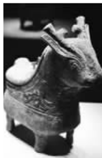
小短腿:西周鸟纹兔形觥