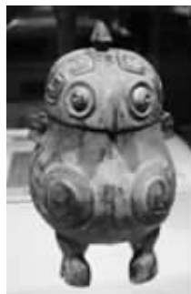
愤怒的小鸟:商代青铜器鸱鸟