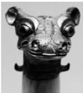
鼻孔哥:战国错金银马首型青铜车