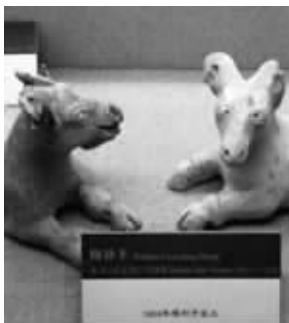
“嘲讽脸”和“天然呆”:陶卧羊

继不久前一件青铜文物被誉为“愤怒的小鸟文物版”后,网友最近又上传了不少中国古代文物的“卖萌”照,从而唤起一波微博热议。陶卧羊一副“天然呆”的萌表情;长着“小苹果脸儿”的商代晚期鸱鸮尊萌萌到极致……在惊叹“古人一卖萌,神都挡不住”的同时,一些网友对这些萌文物产生了兴趣,通过在线交流和查资料,深入了解文化溯源。