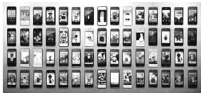
网友用60部iPhone组团,设置talking家族合唱圣诞节歌

的汤姆猫”、“会说话的狗狗本”和“会说话的细菌约翰”外,还有“会说话的卡尔”等不常见的萌系角色,甚至为了应景圣诞节,有几部iPhone内还安装了不同版本的圣诞老人拟声App。制作人根据这些角色的不同音色,巧妙地安排了“合唱团”里的高低声部,所以整首《Deck the Hall》听上去还挺有模有样的。网友们看完都纷纷感慨,“超有爱,太厉害了”,还有些人跃跃欲试,准备也捣鼓个作品出来。