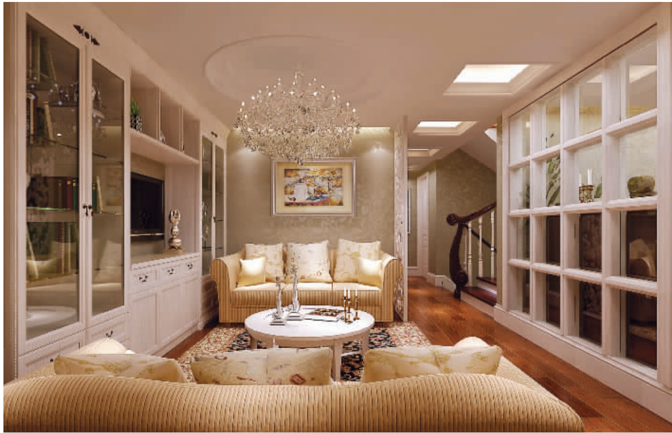
五矿地产作为一家上市企业,拥有雄厚的品牌底蕴和资金实力。2011年,五矿地产力邀龙瑞装饰,打造出御江金城别墅样板房,看中的就是龙瑞装饰一流的施工工艺、优秀的设计团队,以及在业内独树一帜的品牌形象,龙瑞装饰的完美设计,也的确展现出了名流别墅应有的风范。图为龙瑞装饰其中一套御江金城别墅样板房的起居室和主卧设计效果图

可是,龙瑞的特立独行不为哗众取宠,不为欺瞒忽悠,龙瑞的特立独行是建立在引导市场、影响市场的基础之上,是建立在想业主所想,急业主所急的基础之上。与其说龙瑞在以利益为准心的市场环境下,显得有些特立独行,不如让事实说话,看谁能俘获消费者的心,看谁能成为家装界的正道。