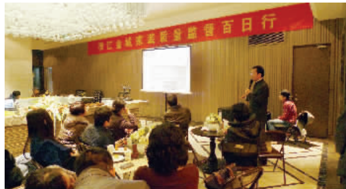
龙瑞装饰携手五矿地产,推出“御江金城家装质量监督百日行”