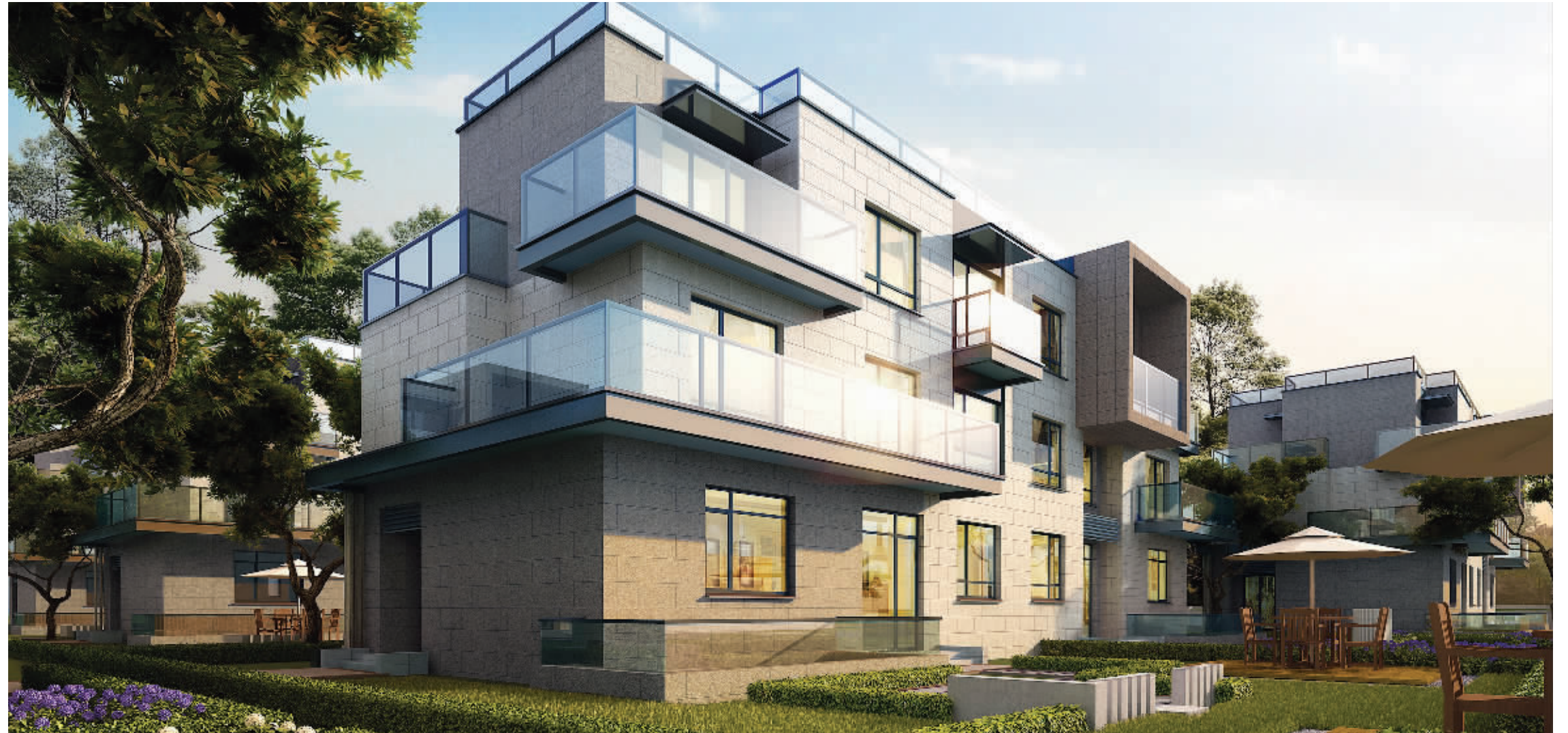
凝聚人性科技,感知更新世界;朗诗造别墅,让您联络未来