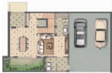
地下一层建筑面积79m²