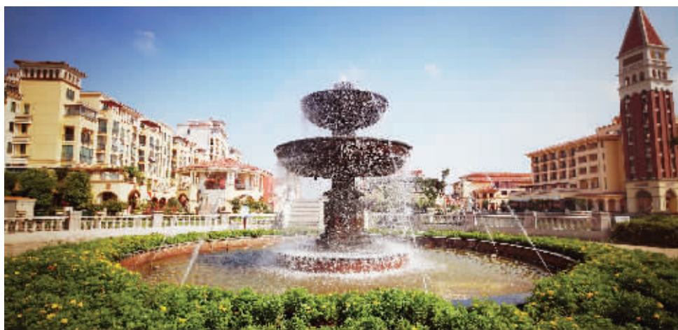
威尼斯水城的街区景观在风格上保持统一的欧式风格

江北超级大盘云集,而最大、最具人气的莫过于威尼斯水城。作为一座450万方大城,作为迄今为止华东地区最大盘,威尼斯水城以占据一线江景的滨江板块,成为备受购房者关注的超级大盘。