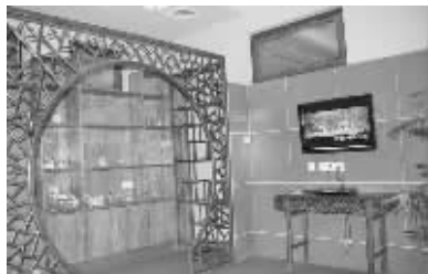
过去里面摆了不少东西 (请供图网友朱先生来领稿费)