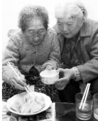
吃到南京的小笼包,老人说味道变了