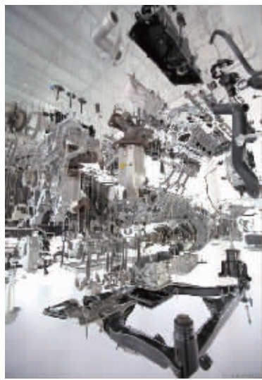
Journey in Motion by Artist Paul Veroude

作为东风日产的创新体验平台,本次展示极具可看性,堪称一次“汽车博览会”。东风日产通过各种先进的体验方式,令创新与科技变得“有温度”、“可感知”、“可触摸”,让来宾在体验中,感受技术日产的魅力。