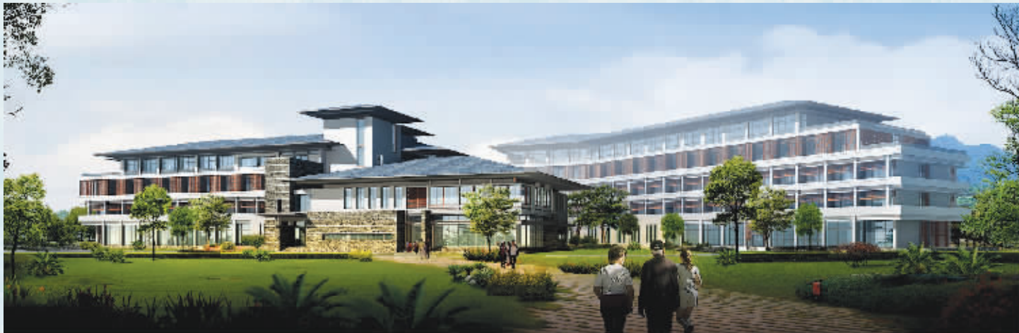
龙湾科技精装小公寓外立面效果图