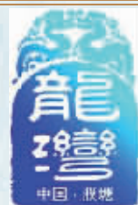
龙湾水文化 养生度假基地