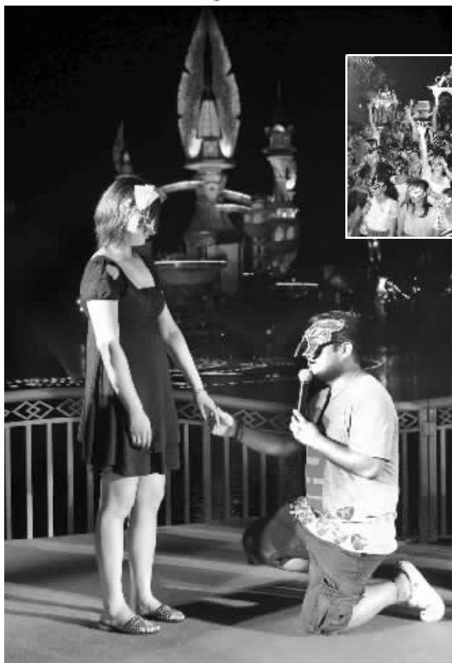
有缘人在嬉戏谷的交友盛宴中找到爱情