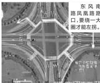
左拐过马路更是绕晕了头