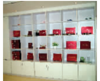
丹凤眼利用资生堂技术研发的护肤品