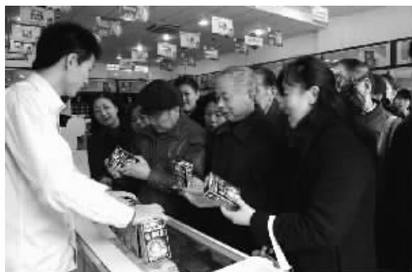
▲皮肤病病友争相选购“霍氏鲜清”小药水

近来,霍氏鲜清在媒体出现频率也颇高,《实话实说皮肤病》和《今日传奇》栏目都相继进行了特别介绍。栏目惊呼,“霍氏鲜清”上市7年来风头不得了,所到之处狂掀皮肤病康复热潮,先后引爆香港、深圳、武汉、重庆等各大城市,到目前为止,全国已有超过1000万皮肤病患者实现了康复。想了解“霍氏鲜清”,首先要了解——霍氏鲜清中神奇的