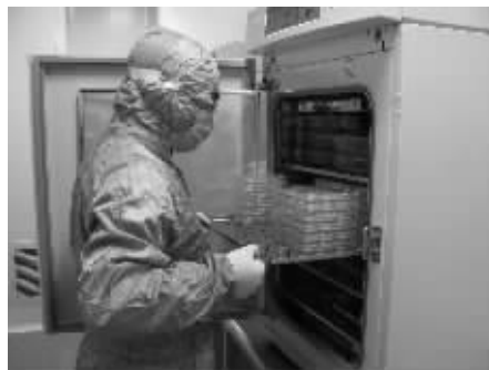
在培养箱中取细胞。

中国人讲究“过年不住院,正月不手术”!自媒体报道了“本年度诺贝尔奖证实:细胞免疫治疗实现肿瘤治疗重大突破!”系列新闻后,细胞免疫治疗受到了患者及家属的广泛关注。眼下天气寒冷且近年关,前来南京454医院肿瘤生物诊疗中心接受细胞免疫治疗的肿瘤患者明显增多,“做好防御性巩固治疗,安心踏实过新年”成众多肿瘤患者的心愿。