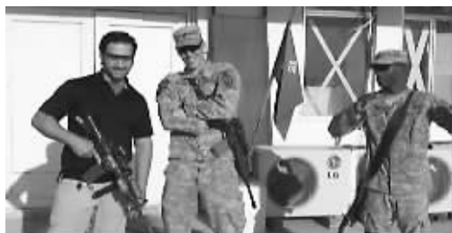
赫克马蒂与美国军人合影