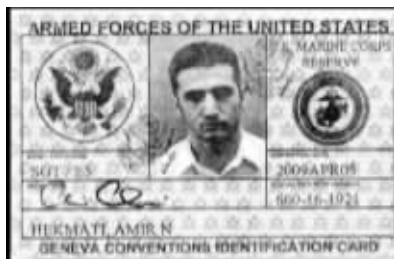
赫克马蒂的英文证件