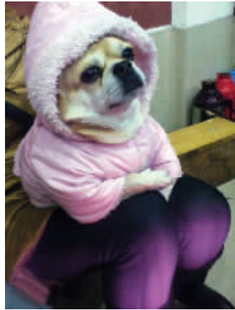
乍一看,此狗颇有人样