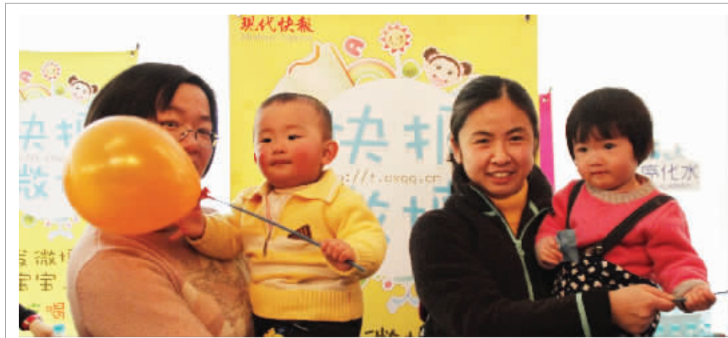
快报微博在水游城进行推广活动,现场有许多家长带着小朋友前来咨询