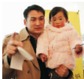
帅爸美妞咨询快报微博