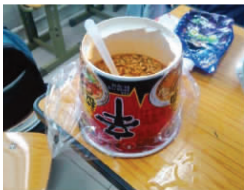
你到底吃过碗装方便面没有啊