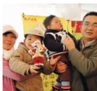
@然然荃荃幸福四人行