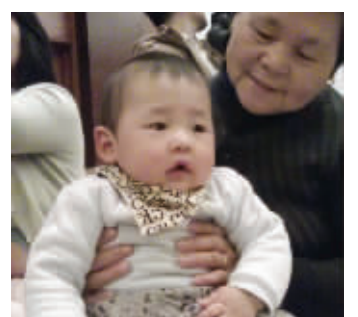
@小青卿和奶奶看表演