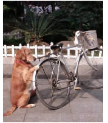
“你在干嘛?”“给主人看车。”