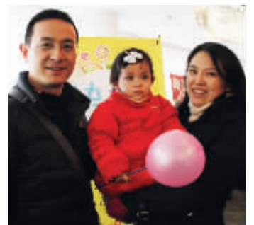
超像混血儿的小美女