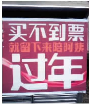
买不到票,宿舍阿姨照顾你