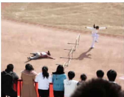
学校运动会一幕:白鹤亮翅