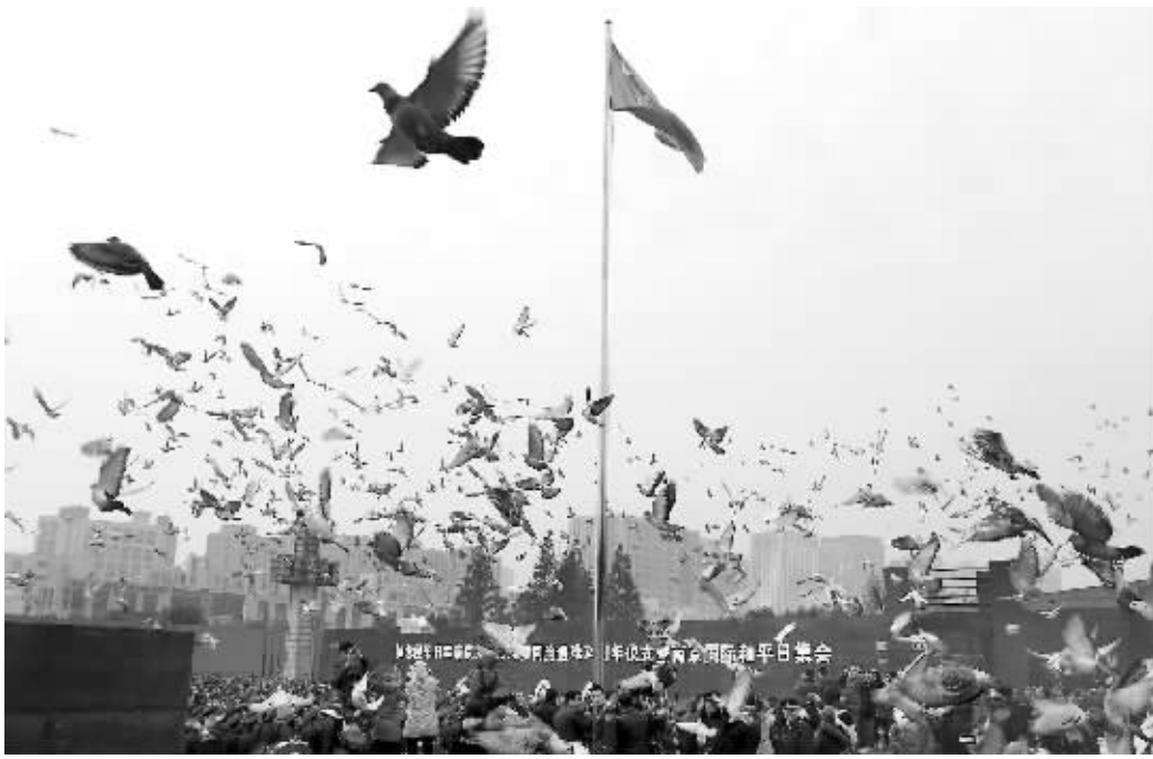
昨天,江东门纪念馆举行侵华日军南京大屠杀30万遇难同胞悼念活动