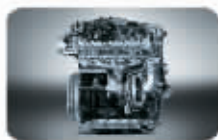
1.8TSI 涡轮增压直喷发动