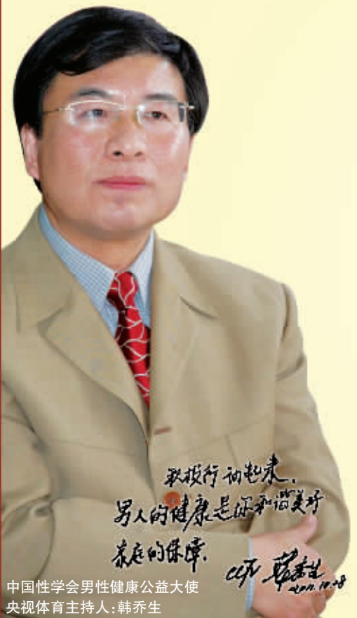
中国性学会男性健康公益大使 央视体育主持人:韩乔生