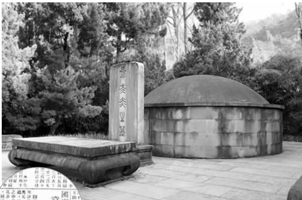
位于杭州的章太炎墓

葬礼完成后,汤国梨为了完成丈夫与张苍水为邻的遗愿,四处奔走。虽然国葬令已经批下来,但是政府并没有遵照规定实施。很快全面抗战爆发,国民党相关人员奔逃,国葬一事一拖再拖,不了了之。没办法,为了安全考虑,汤国梨只好将太炎先生的灵柩葬在苏州家中的后园内,园子里有一口鱼池,一天晚上家人偷偷把池水放干,砌成墓穴,把灵柩暂时放在里面。