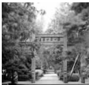
章太炎墓与张苍水墓比邻而居

1936年6月14日,章太炎因病逝世,太炎先生的生前好友向国民政府提出,应对章太炎举行国葬。1936年7月1日的国民党中央政治委员会第十七次会议上,作出了“章炳麟应予国葬,并受国民政府褒恤”的决定。7月10日,《中央日报》上正式公布了“国葬令”。