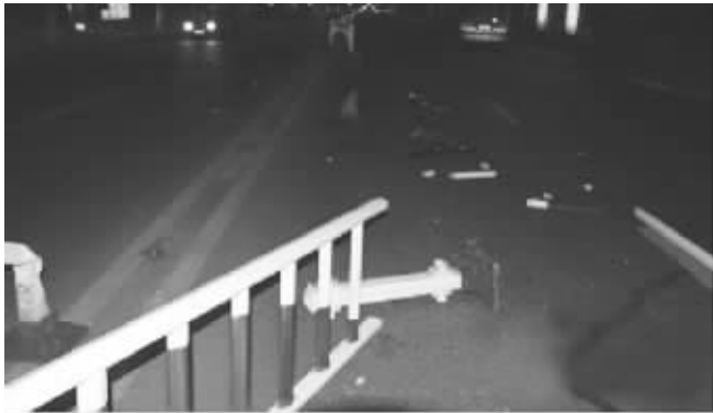
十余节护栏被撞坏

记者注意到,这段视频来自于青果巷与南大街十字路口的监控画面,距离事故地点大约五十米左右,肇事车的车牌未能呈现在画面中。不过,据办案民警讲,他们通过现场残留的肇事车的碎片分析,肇事车为奔驰CLK型号红色轿车。警方调看了前方