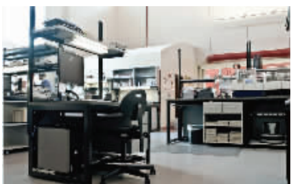
奔腾自热地板检测科研实验室

为了让业主抢先体验到这一产品,奔腾地板将征集100户样板间,此次样板间征集奔腾承诺零利润,而从他们给出的政策——4980元铺装一间11平米居室,普通地板也要这个价,何况还有地暖和保健等多重功能。有采暖需求的业主,得赶紧拨打电话报名了,良机不容错过。